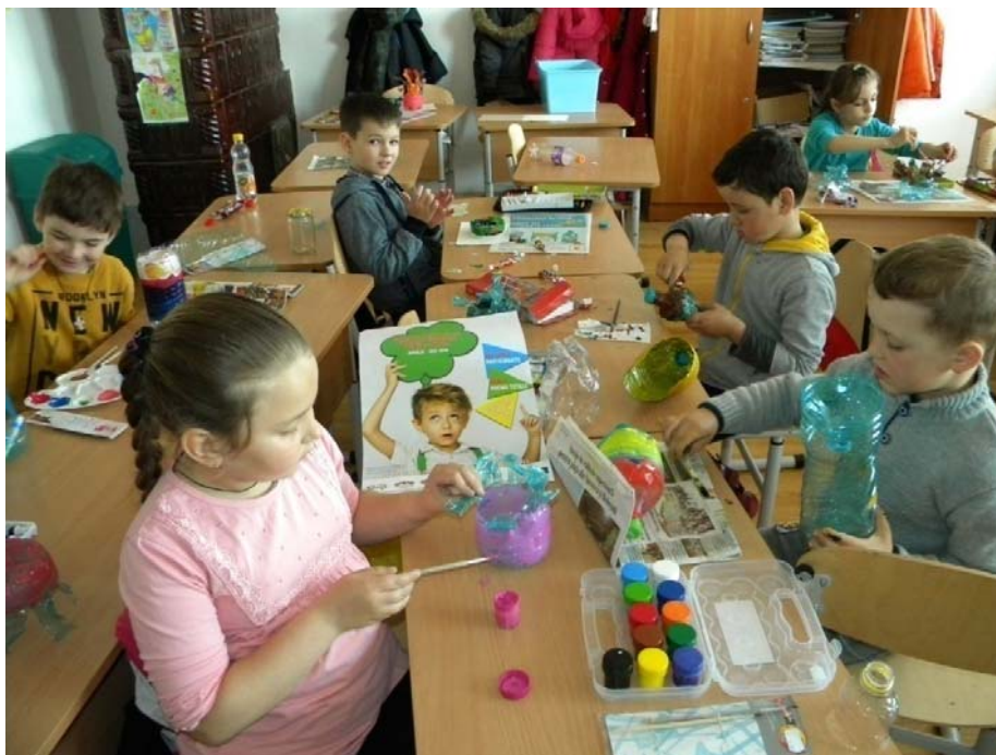
"Natura- dragostea mea"- formarea manierelor durabile prin confecționarea de vase pentru flori, suporturi pentru creioane, obiecte practice dar și decorative